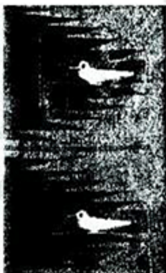
(۴) سیروس ابراهیمزاده