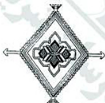
(۳) آرام قریب